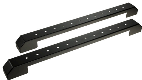
Sada soklů VR-SOK-B