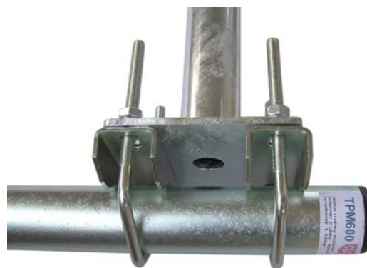
BKO400 + 2x Z85DV85