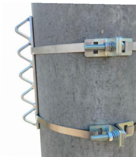
aplikácia KPRU16 TWIN ( montáž DNK250 )