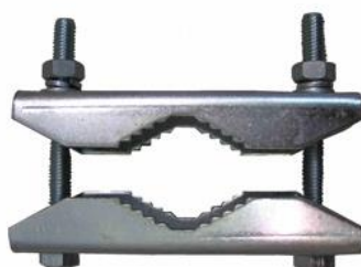
dvojica žralokov Z21