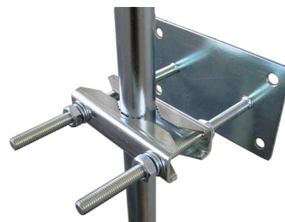
využitie Z1S pre úchyt PLZ3-170S