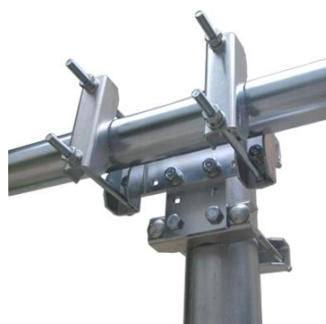
STR9 + TPM1500 + STM1500