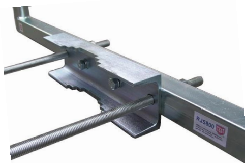
detail uchytenia STR20 + RJS800-STR