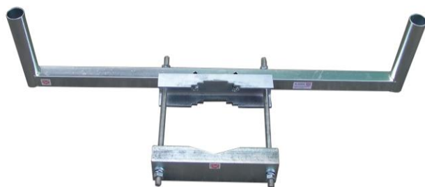
STR20 + RJS1000-STR