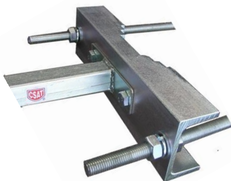
detail uchytenia konzoly s roztečou 105mm