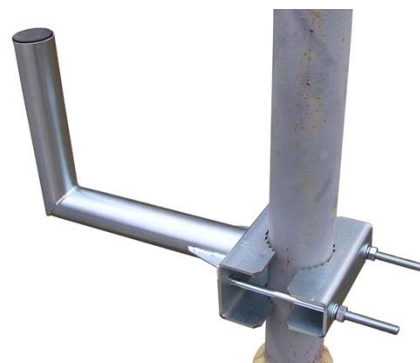
KS3EX + Z14 + príslušenstvo