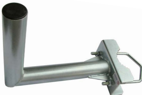
KS3EX + V140 + príslušenstvo

Za príplatok je možné objednať KS3EX s povrchovou úpravou žiarový zinok ( MAZ ), pre úpravu MAZ sa poskytuje záruka 5 rokov.