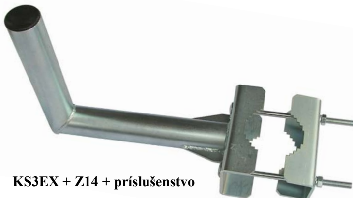
KS3EX + Z14 + príslušenstvo

Pomocou úchyty ( žraloka ) Z14 alebo V140 ( dĺžka 210mm, závit M12 ) je možné konzolu inštalovať na stožiar ( trubku ) s priemerom od 89 do 127mm . Príslušenstvo pre Z14 tvoria vratové skrutky DIN603 M12x240 ( závit 85mm ) , príslušné podložky ( DIN125 a DIN127 ) a matice M12 ( DIN934 ) , pre V140 sú to podložky ( DIN125 a DIN127 ) a matice M12. Príruba KS3EX ( hrúbka plechu 5mm ) je vyrobená laserovým rezaním.