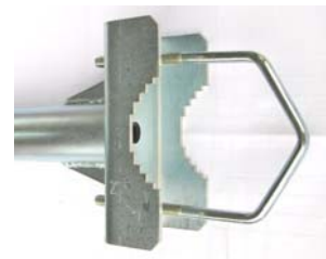
príruba KS3EX + V140