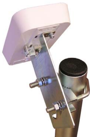
aplikácia s DM60-MT