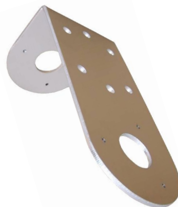
plech ( telo držiaka ) HIK100L TWIN-C