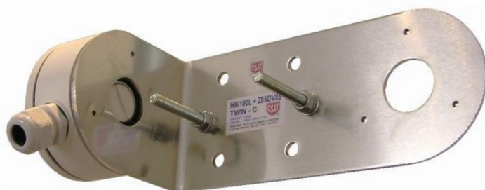
DS-1280ZJ-XS + HIK100L TWIN-C + Z85DV85