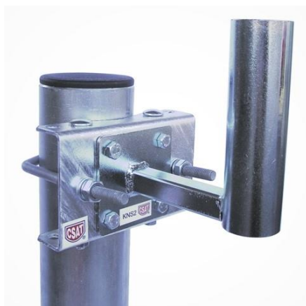
STR105V + KNS2

povrchová úprava žiarový zinok ( MAZ ) - záruka 5 rokov