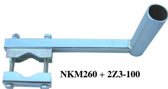
NKM260 + 2Z3-100