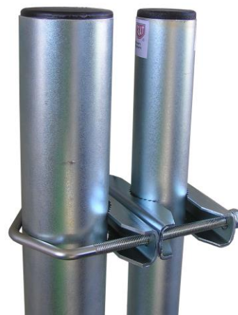
príklad použitia STR21D