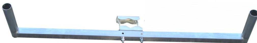
RJV1200 + 2Z5M