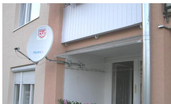
príklad aplikácie RPM 1150 a PLZ3M ( montáž SAT paraboly )