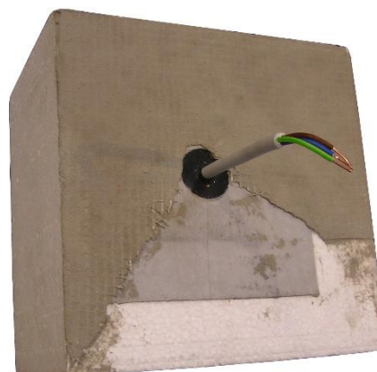
aplikácia s MPK6-10