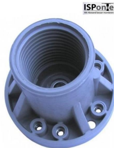
vrchná časť ISPonte sady so zalisovanou maticou M10 v strede