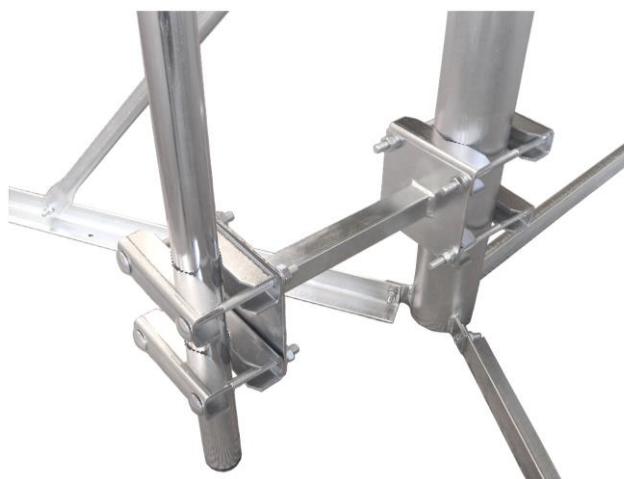
aplikácia s DS250+ 2x 2Z5M