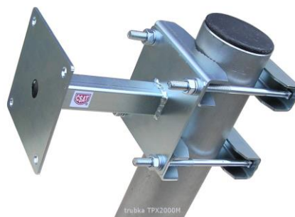
aplikácia s DS150+ 2x 2Z5M